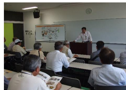
クリーンセンター

また、木之川内ダムは、都城盆地管内の畑地におけるかんがいのための新たな水源として平成21年度に完成し、貯水量は約600万m 3 約400haの畑地に送られる計画です。