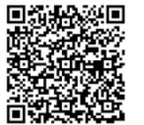
マイナちゃんカー 申し込みフォーム

マイナンバーカードの出張申請補助に専用車（マイナちゃんカー）で、市職員が市内のご自宅に伺います。