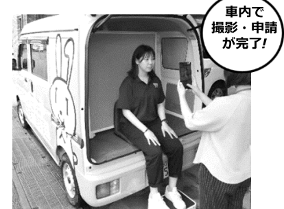
車内で撮影・申請が完了!