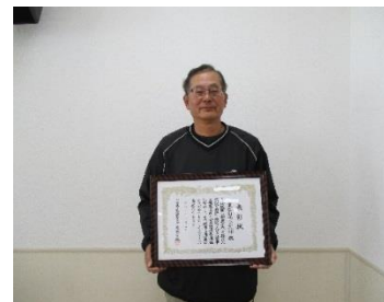
東区自治公民館 奥田館長

また、昨年優良自治公民館報を受賞された東区自治公民館が、今年度宮崎県の表彰を受けられました。