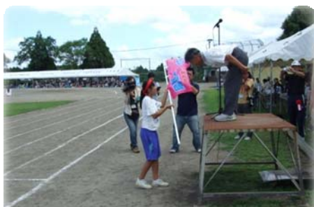
【中学校体育祭での贈呈式の様子】

庄内地区の「心のプレゼント運動」は、庄内地区青少年育成連絡協議会が中心となり、平成十五年度より運動を始めました。区内の小・中学校4校では、毎月「心のプレゼント運動週間」を設け、【明るいあいさつ（やさしい心）】・【ありがとう（感謝の心）】・【人が喜ぶこと（思いやりの心）】の3つの柱で運動を進めています。今回、学校と家庭と地域が一体となって、この運動を推進しようという目的で協議会【教育文化活動部会】が、のぼり旗60枚を作成しました。美術部員によるデザインにより、ピンクを基調にハートのマークや文字があしらわれた、とても温かみのあるのぼり旗が完成しました。