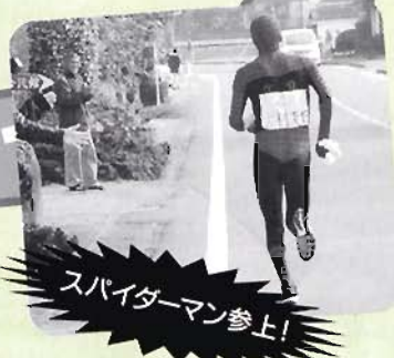
スパイダーマン参上!