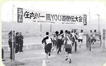
花の第一区走者がスタート