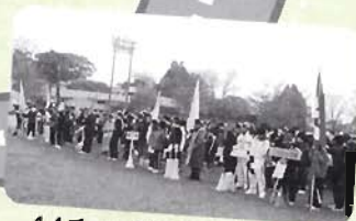
14チームが参加した開会式