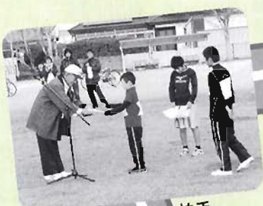
児童生徒の奮闘は拍手