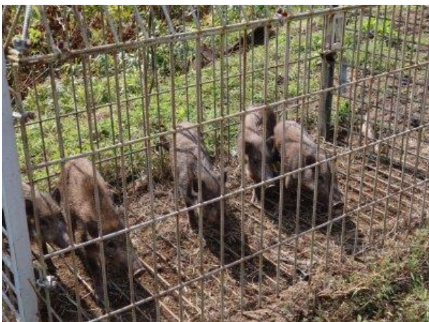
関之尾 5 頭同時捕獲 2020.10.27