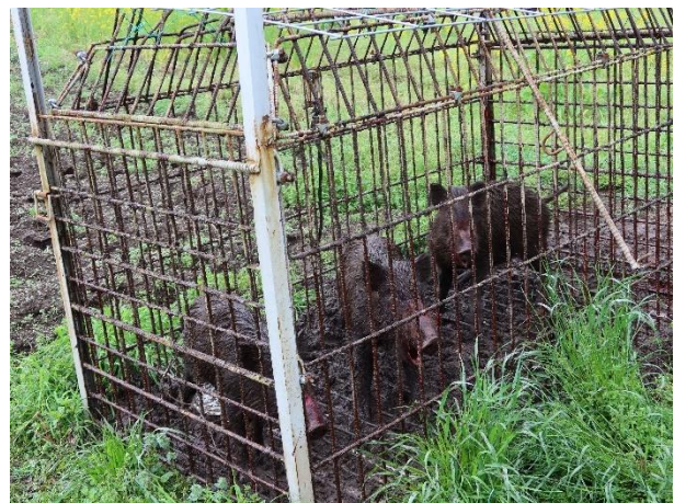
令和 5 年 3 月 24 日 イノシシ 3 頭捕獲 関之尾町