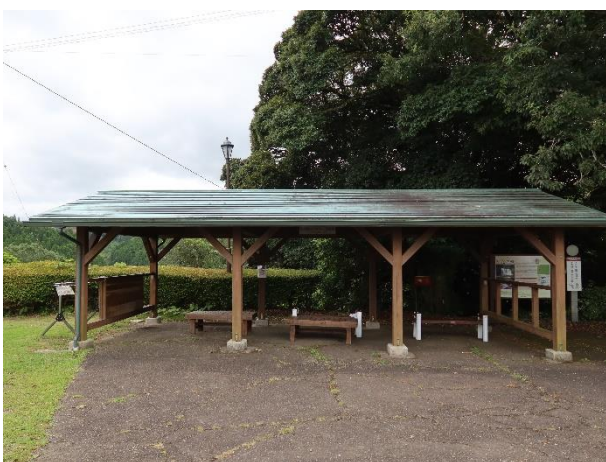
関之尾滝の駅東屋移築前