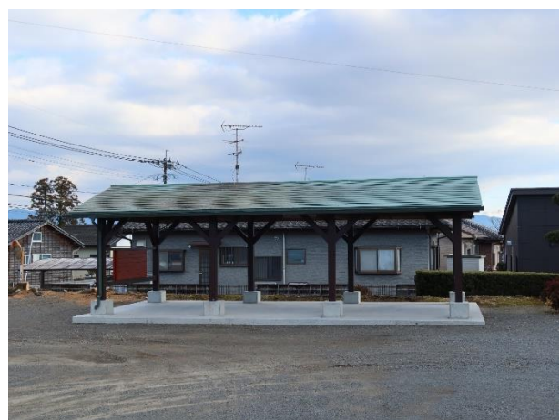
千草自治公民館移築後