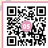
坂道を上げらず右へ