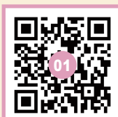
左手の坂道を上る