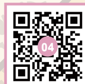
左手の坂を上がる