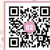
一番右の道を下る